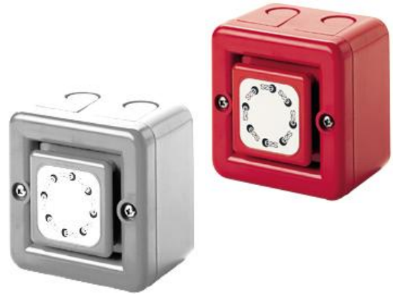
Niewielkich rozmiarów syrena, idealne do zastosowań ostrzegawczych i p-poż.